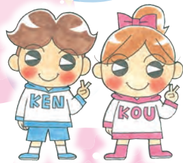
健康づくり計画推進キャラクター 「ケンちゃん・コウちゃん」